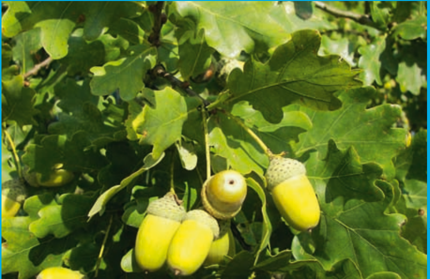
Stiel-Eiche – Quercus robur