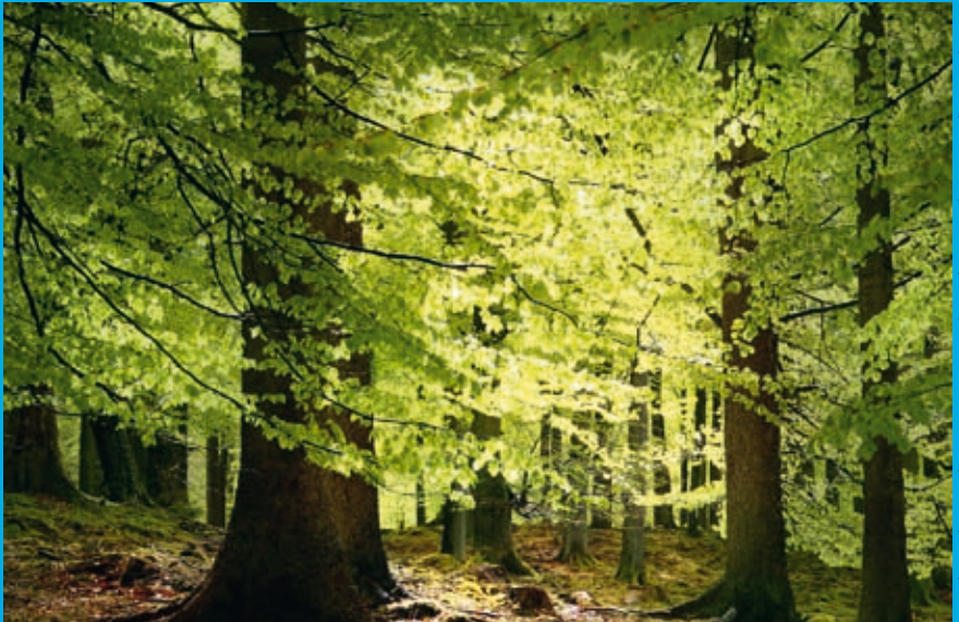
Rot-Buche – Fagus sylvatica